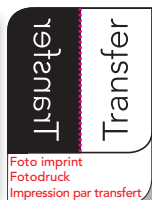
Foto imprint Fotodruck Impression par transfert

Logo size / Logo Grösse / taille du logo: